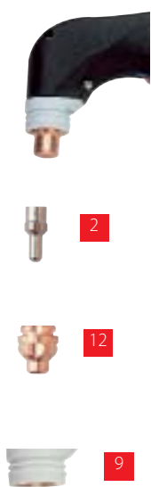
Piese de uzura pentru pistol JET CP 0.5